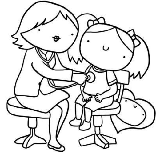
DIRITTO ALLA SALUTE