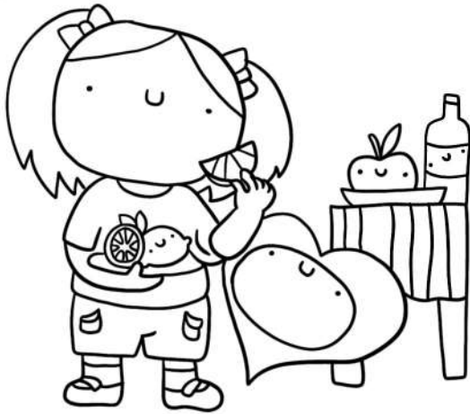
DIRITTO AD ESSERE NUTRITO