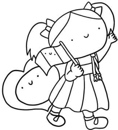
DIRITTO AD AVERE UNA NAZIONALITÀ